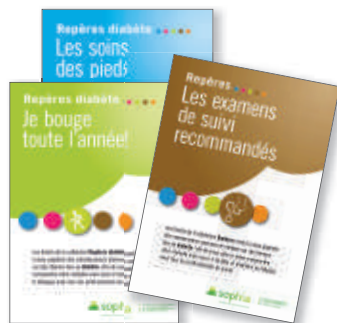
Réalisés en collaboration avec l'INPES et les associations de patients