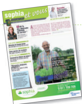
Elaboré avec les associations de patients et des médecins